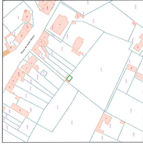
Plan Cadastral Echelle : 1/2500

PLAN D'UNE D'UNE PARCELLE NON BATIE A PRENDRE AU SEIN D'UNE PLUS GRANDE NON BATIE Cadastrée Mons Div. 11 (Saint-Denis), S°A n° 117R