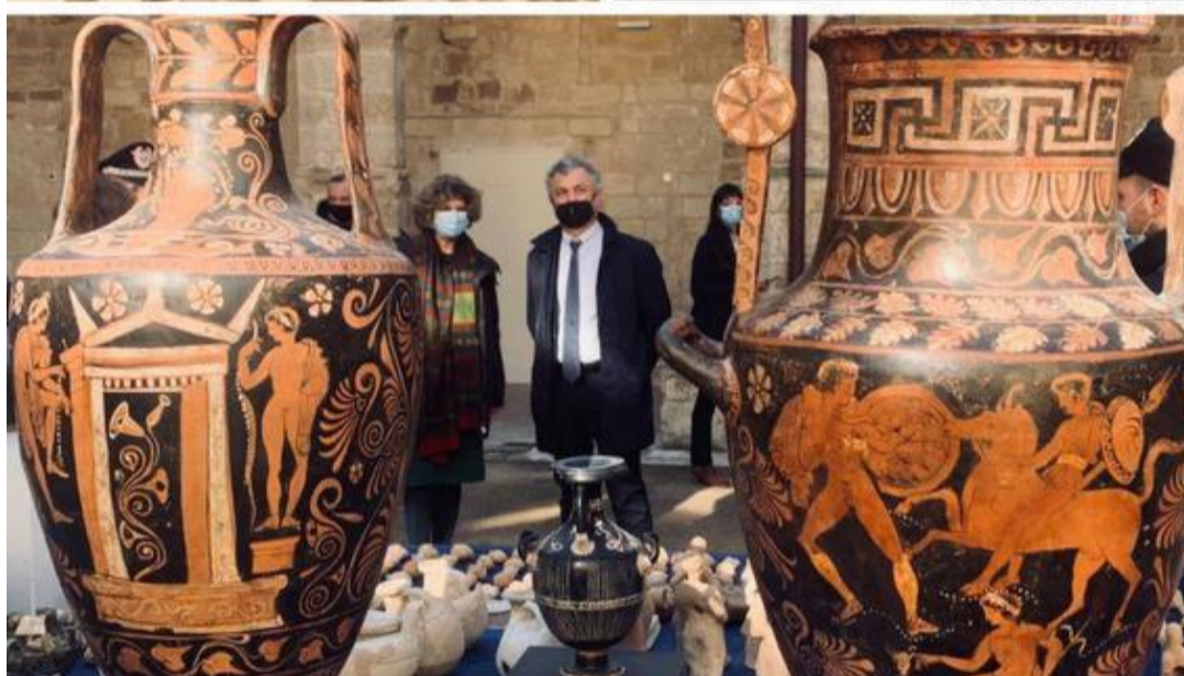
Un incroyable trésor !

des chemins de fer du Brenner. Dans ses bagages, l'homme avait une amphore archéologique. Relâché, il a été suivi par les moyens les plus sophistiqués. Ce qui a permis de découvrir l'étendue de ce trafic qui a mené les enquêteurs, non seulement en Belgique mais aussi en Suisse, en Allemagne et aux Pays-Bas. À Delft, il y avait le