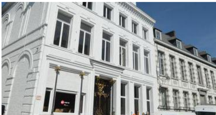
Vue de l'extérieur.

La Maison Losseau intègre le « RANN » (Réseau Art Nouveau Network) qui vise à informer les professionnels et à sensibiliser le grand public à l'importance du patrimoine Art nouveau. De nouvelles perspectives pour le site montois.