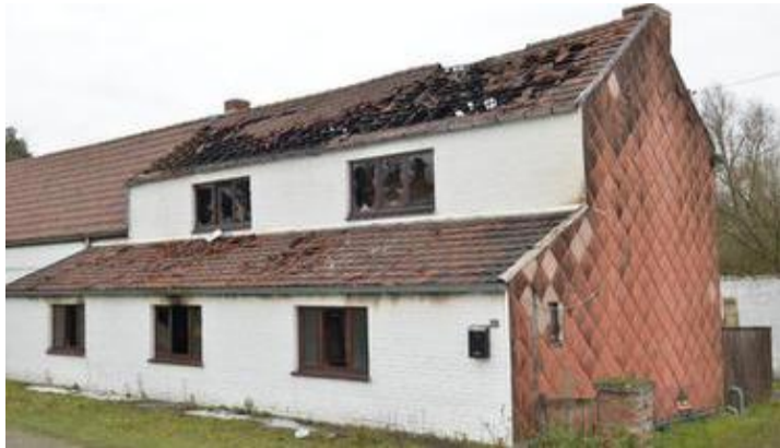
La toiture a subi de gros dégâts.

Un incendie s'est déclaré ce dimanche à l'avenue Benoîte à Havré, derrière la cité du Congo. La maison est détruite. Les pompiers sont restés plusieurs heures sur place. Tous les occupants, dont un enfant, ont été pris en charge par les secours.