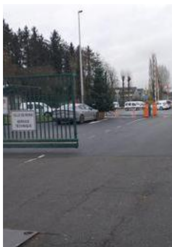
La caserne Cabuy

Concrètement, cela veut dire que la caserne aura une chaudière qui utilise des combustibles organiques, comme le bois. Ce genre